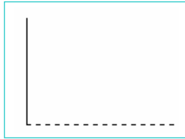
شكل (٣- ١٥) الشكل بعد تنشيط العنصر الأول ويبدو الخط الأفقي نشطاً أي منقطاً .